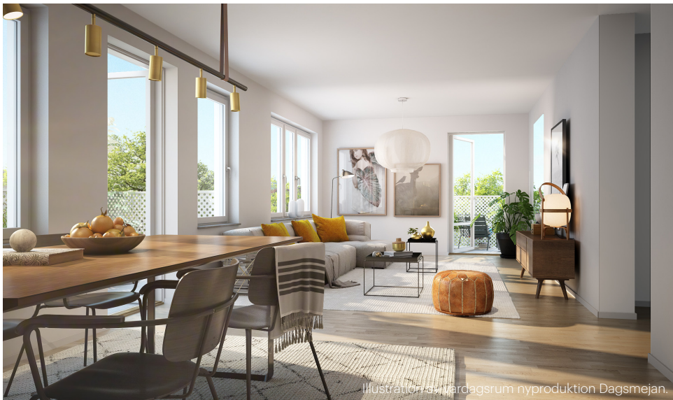
Illustration av vardagsrum nyproduktion Dagsmejan.