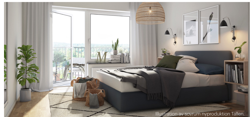
Illustration av sovrum nyproduktion Tallen.

I så fall dra ur utrustning och prova återställa igen. Går det återställa så är det fel på den utrustning som sattes in i uttaget.