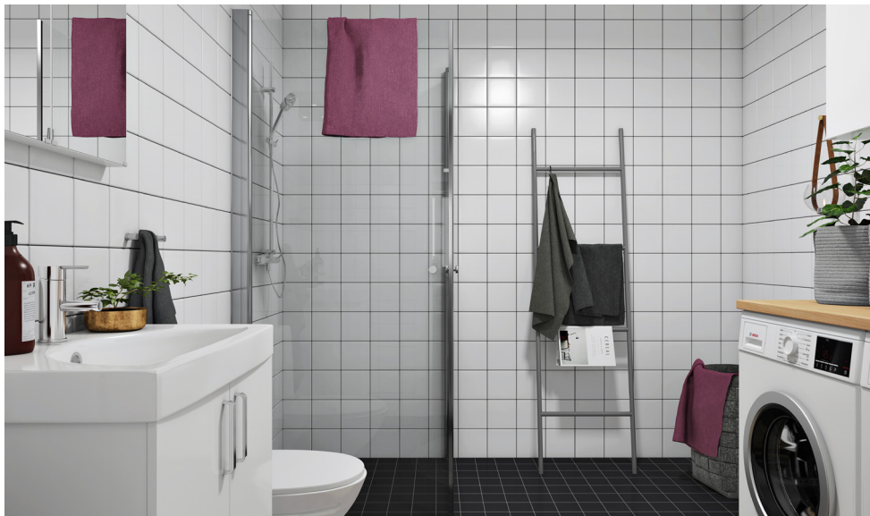
Illustration över ett badrum, observera att badrum kan se olika ut beroende på var du bor.